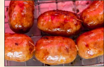
Isan Pork Sausage