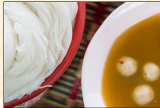
Rice Noodles with Fish Curry