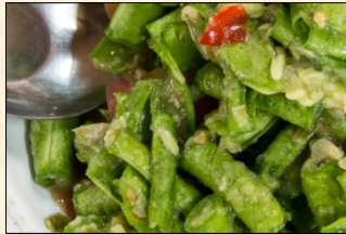
Green Bean Som Tam