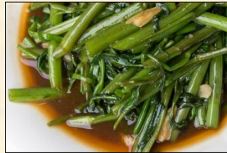
Stir-Fried Morning Glory