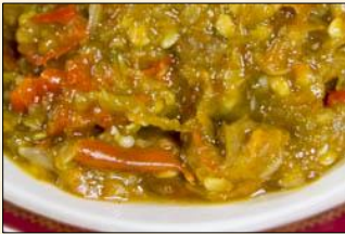
Tomato Dipping Sauce