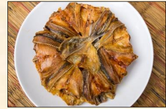
Fried Circle Fish