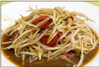
Papaya Som Tam