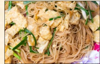
Stir-Fried Rice Noodles