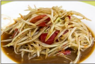
Papaya Som Tam