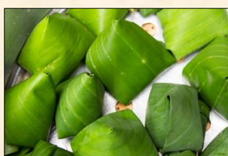
Sago Dumplings in Banana Leaf