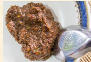
Fermented Fish Dipping Sauce