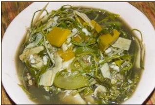
Bamboo Shoot Curry